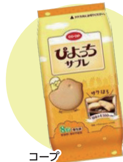
コープ ひよこサブレ